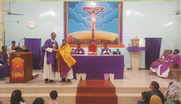
Golden Jubilee Celebration at Dharmapuri