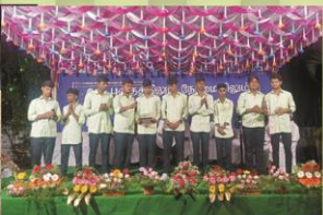
Feast Mass at Minor Seminary