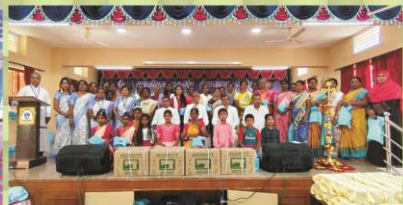
Women's Day celebration at Pastoral Centre & Palacode