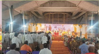
Chrism Mass at New Cathedral