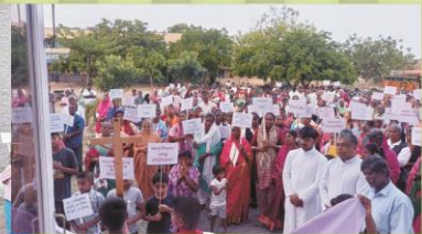
Pro-Life way of the Cross at Selliampatti